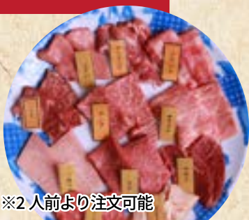
※2人前より注文可能