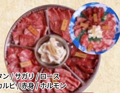
タン/サガリ/ロース カルビ/赤身/ホルモン