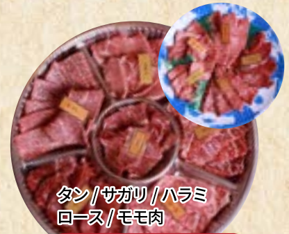
タン/サガリ/ハラミ ロース/モモ肉