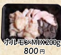
ホルモンMIX200g 800円 (税込 864円) たれもみ込み +108円