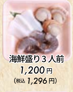
海鮮盛り3人前 1,200円 (税込 1,296円)

2~3人前 4,200円(税込4,536円) 4~6人前 7,300円(税込7,884円)