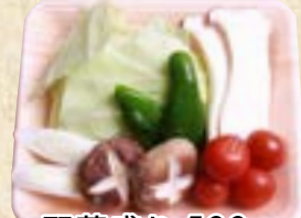
野菜盛り500円 (税込 540円)