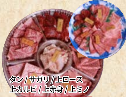
タン/サガリ/上ロース 上カルビ/上赤身/上ミノ

2~3人前 5,800円(税込6,264円) 2~3人前 4,500円(税込4,860円) 4~6人前 9,800円(税込10,584円) 4~6人前 8,500円(税込9,180円)