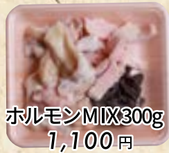
ホルモンMIX300g 1,100円 (税込 1,188円) たれもみ込み +108円