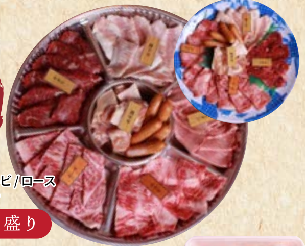
タン/サガリ/カルビ/ロース 豚/トリ/ウインナ