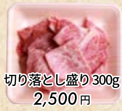
切り落とし盛り300g 2,500円 (税込 2,700円) たれもみ込み +108円