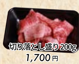
切り落とし盛り200g 1,700円 (税込 1,836円) たれもみ込み +108円