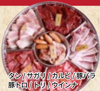
タン/サガリ/カルビ/豚バラ 豚トロ/トリ/ウインナ